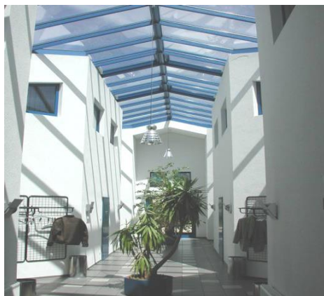
BBI Berufsbildungsinstitut - Haßfurt

Inhalt des Kurses: Musizieren mit einfachen Instrumenten und Klangschaalen sowie das Singen von bekannten alten Liedern