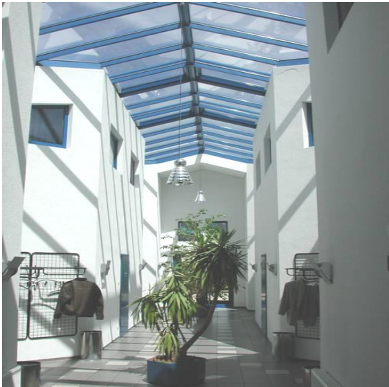
BBI Berufsbildungsinstitut - Haßfurt

Ihr Tätigkeitsfeld umfasst die Betreuung von Demenzkranken, die Unterstützung von Fachkräften in der Altenpflege und die Hilfe bei allen hauswirtschaftlichen Angelegenheiten der Bewohner und bei der Haushaltsführung für alte und kranke Menschen, die noch in ihrem bisherigen Umfeld leben.