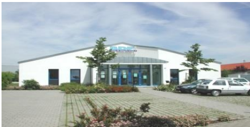
BBI Berufsbildungsinstitut – Haßfurt

= Betreuungskraft + Pflegeassistentz + Hauswirtschaft