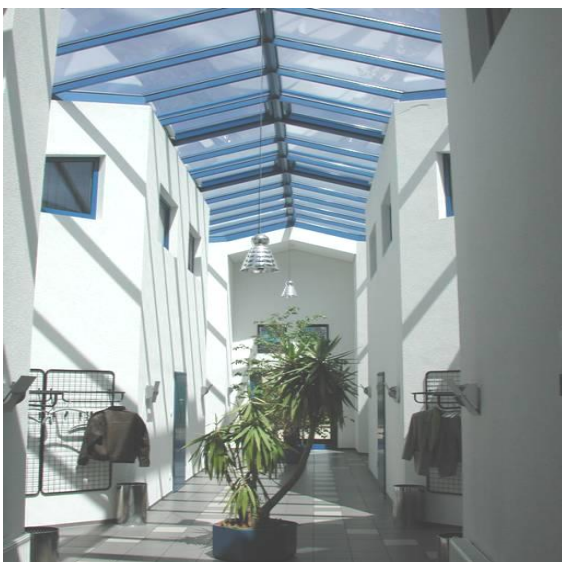
BBI Berufsbildungsinstitut - Haßfurt

Ihr Tätigkeitsfeld umfasst die Betreuung von Demenzkranken, die Unterstützung von Fachkräften in der Altenpflege und die Hilfe bei allen hauswirtschaftlichen Angelegenheiten der Bewohner und bei der Haushaltsführung für alte und kranke Menschen, die noch in ihrem bisherigen Umfeld leben.