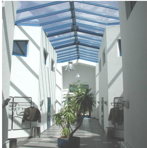
BBI Berufsbildungsinstitut - Haßfurt

Und Sie erkennen Ihren persönlichen Entwicklungsbedarf und Ihre abzubauenen Hindernisse oder Blockaden. Das individuelle-Coaching ist darauf ausgerichtet, Sie für Ihren beruflichen Neustart vorzubereiten und Ihnen Orientierungen über die Anforderungen und persönlichen Möglichkeiten im Arbeitsleben zu geben.