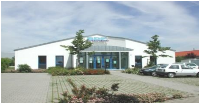
BBI Berufsbildungsinstitut - Haßfurt