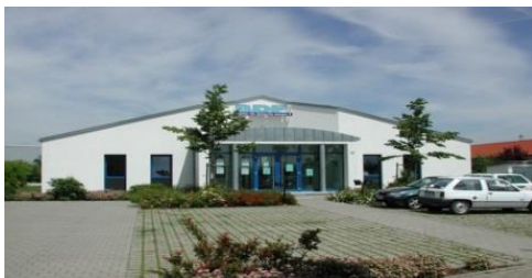
BBI Berufsbildungsinstitut - Haßfurt

BBI – Berufsbildungsinstitut Lohwasser e.K. Industriestr. 53 - 97437 Haßfurt Tel. 09521 610 30 50